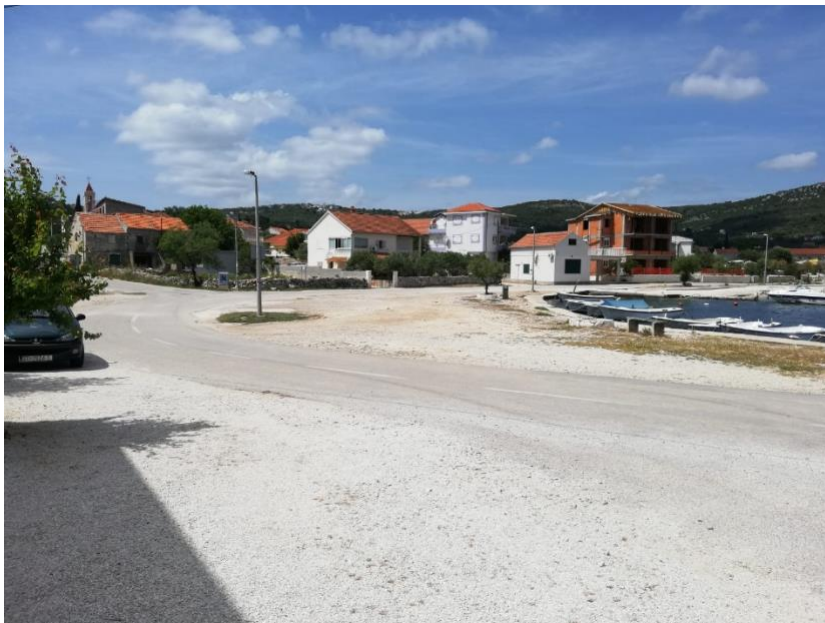
Prostor predviđen za parkiranje vozila sudionika 1. Plivačkog maratona „Vinišće“